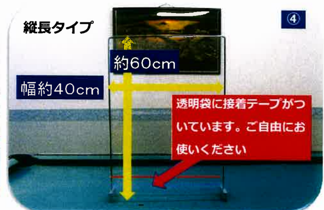
縦60 cm×40 cm 透明袋10枚1セット 5枚1セットもあります