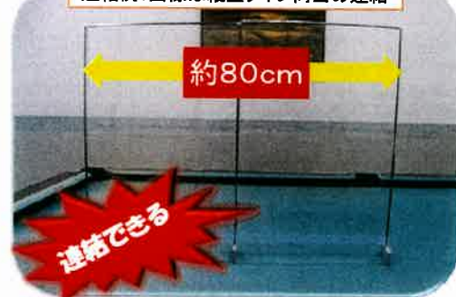
連結例：画像は縦型タイプ同士の連結