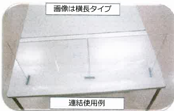
画像は横長タイプ

標準付属品の「丸足」を使えば、放射状にパーテーションが広がり、今まで遠慮していた休憩談話スペースなどでの会話も弾みます。（下記画像を参照ください。）