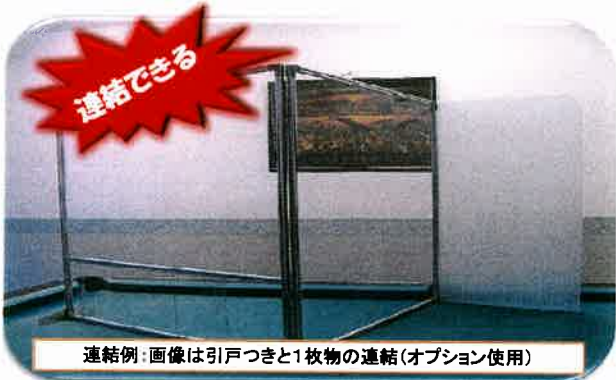
連結例：画像は引戸つきと1枚物の連結(オプション使用)