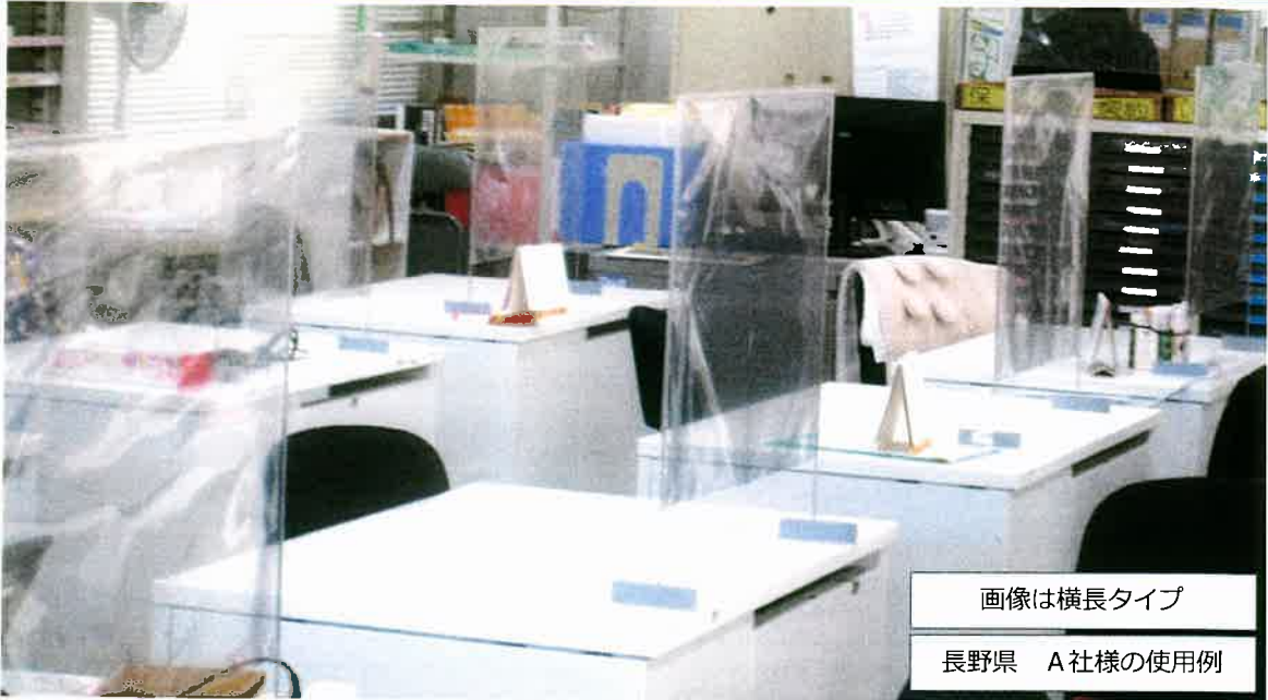
画像は横長タイプ