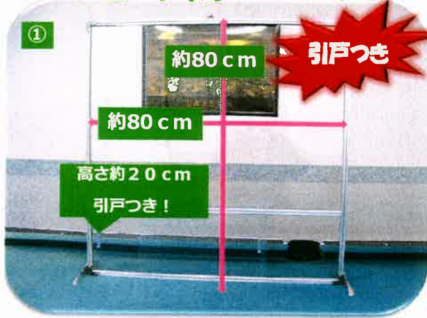
① 80 cm×80 cm 引戸付