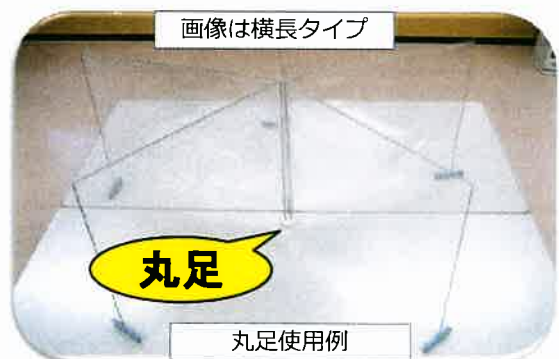
画像は横長タイプ